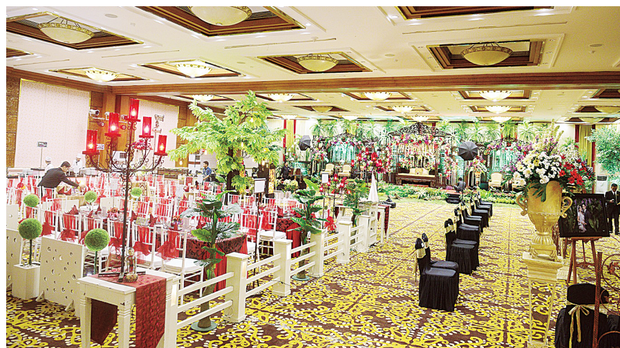
Patra Hotel & Convention Semarang