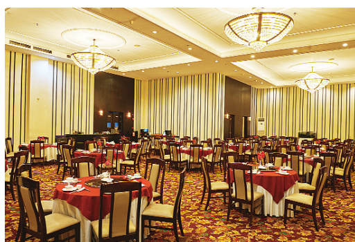
Palace Fine Cuisine & Ballroom

Royal Dome menyediakan fasilitas ballroom (indoor) dan poolside (outdoor). Venue yang mengusung konsep Klasik Romawi Eropa juga menjadi one stop life style modern multifungsi dengan fasilitas fitness center, aerobic, billiard, table tennis, kids room, functional room, swimming pool, dan garden yang disediakan untuk berbagai acara. (58)