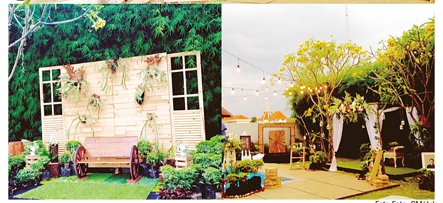
Sisingamangaraja Guest House