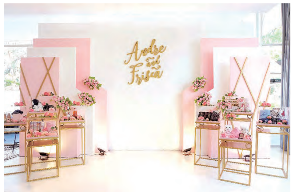
Belle and Rose Decoration

Balon Bunga Decoration yang sudah melintang di bidang dekorasi ulang tahun, pernikahan, dan acara pesta di Semarang ini juga menyarankan tips mempersiapkan dekorasi sebuah pesta. "Tentukan terlebih dahulu tema