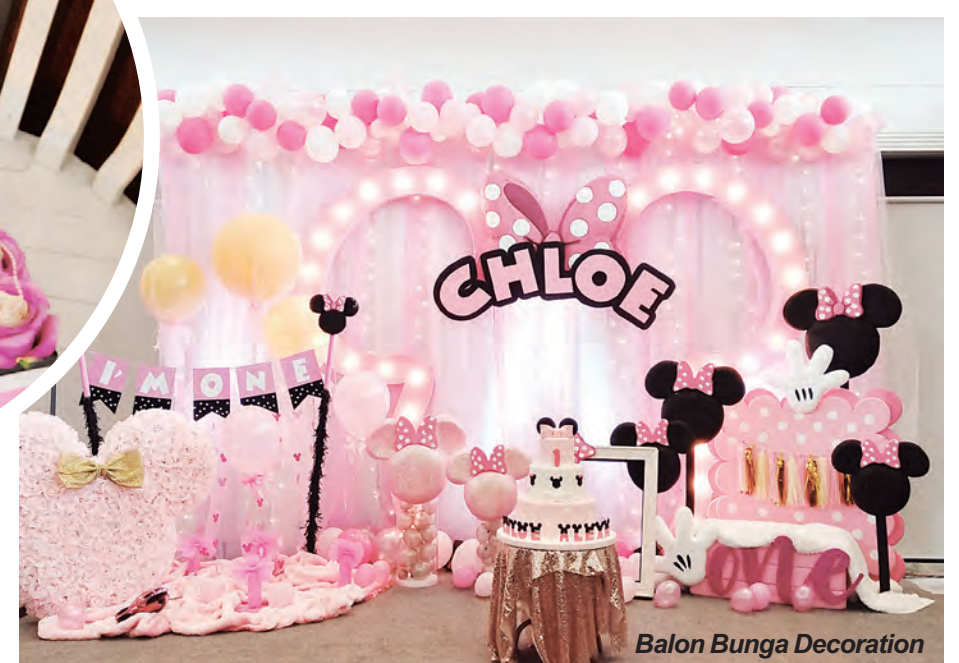
Balon Bunga Decoration

Dewi Florist yang menyediakan bunga meja, buket bunga, flower girl , bunga poster, dan hamper ini juga menuturkan tren dekorasi saat ini lebih mengarah ke tema minimalis. Setelah menyimak saran dari empat vendor dekorasi asal Semarang ini, tentu tak perlu bingung lagi untuk menuangkan karakter dalam dekorasi pesta impian.(58)