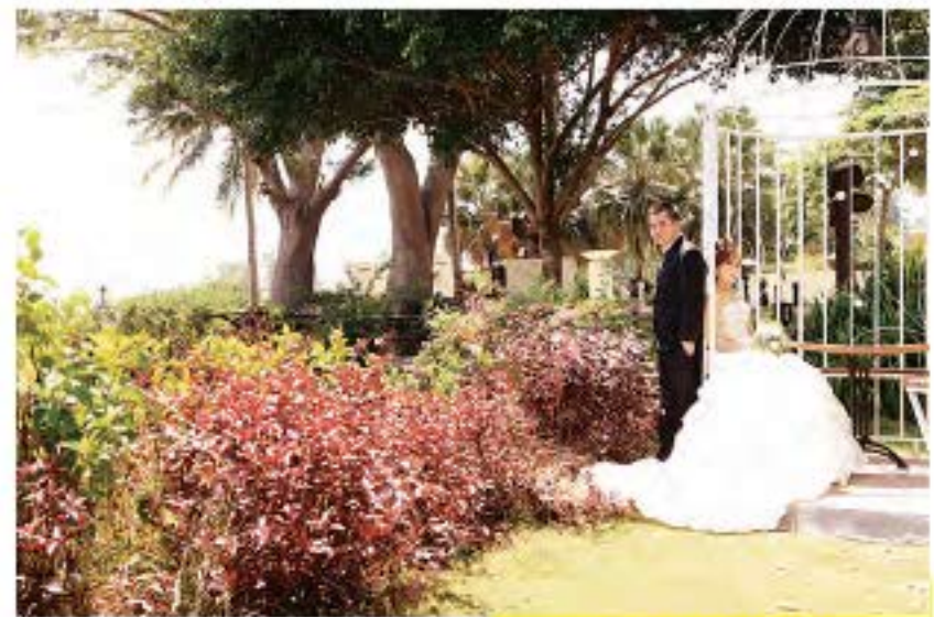
Johnny Foto Video

Vendor yang menawarkan jasa foto prewedding , photo wedding , photo kiddy , graduation , teenage , company profile , product , dan event ini juga membocorkan tips membuat foto terlihat indah. "Tips untuk foto wedding semua harus disesuaikan mulai dari dekorasi, gaun, tema, dan pengaturan waktu yang tepat agar hasil