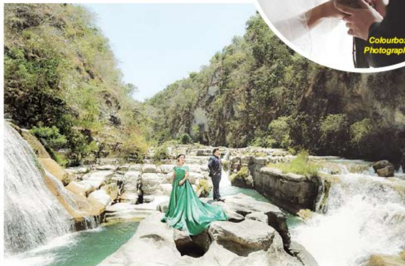
Friends Photo Video